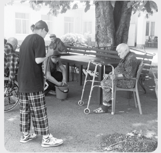
По информации пресс-службы ГБУСО «Предгорный КЦСОН».

Помощь ребят всегда действенна и очень нужна пожилым землякам.