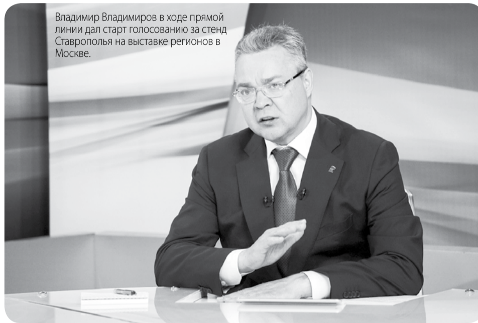
Владимир Владимиров в ходе прямой линии дал старт голосованию за стенд Ставрополья на выставке регионов в Москве.